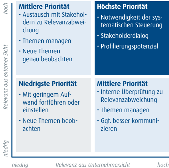
Abbildung 6: Materialitätsanalyse