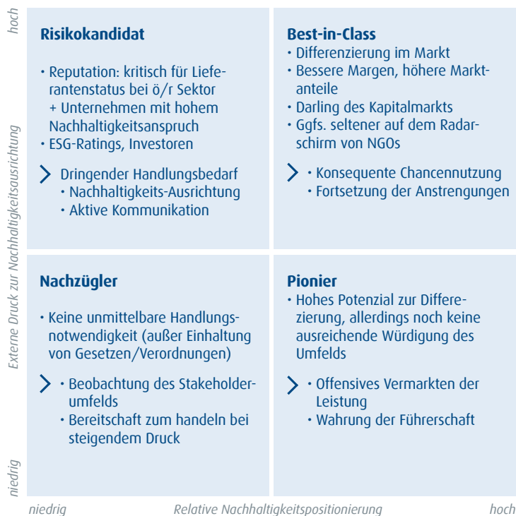
Abbildung 7: Nachhaltigkeitsausrichtung und -positionierung

Welche Rolle spielt Nachhaltigkeit in meiner Industrie und wie ist mein Unternehmen dazu positioniert?