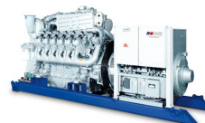
Gas- betriebene Energie- systeme